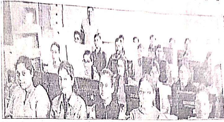
घुमारवीं : स्वामी विवेकानंद राजकीय महाविद्यालय घुमारवीं में साइबर जागरूकता सत्र द्वारा आयोजित कार्यक्रम में उपस्थित विद्यार्थी।

उन्होंने बताया कि हमें इंटरनेट का उपयोग बहुत ही सावधानी से करना चाहिए। मोबाइल फोन को वित्तीय