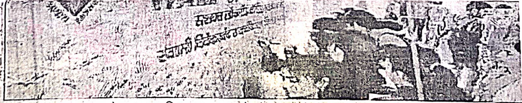
घुमारवीं ; मतदान के शत-प्रतिशत लक्ष्य को प्राप्त करने के उद्देश्य से स्वामी विवेकानंद राजकीय घुमारवीं में आयोजित हस्ताक्षर अभियान में भाग लेते विद्यार्थी।