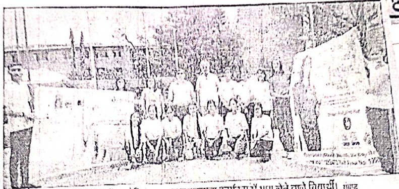
घुमारवीं कॉलेज में आयोजित मतदाता जागरूकता कार्यक्रम में भाग लेने वाले विद्यार्थी।