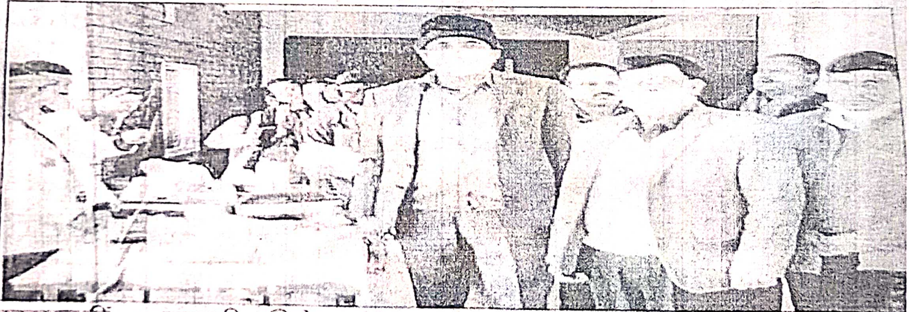
घुमारवीं : स्वामी विवेकानंद राजकीय महाविद्यालय घुमारवीं में आयोजित स्वास्थ्य जांच शिविर।