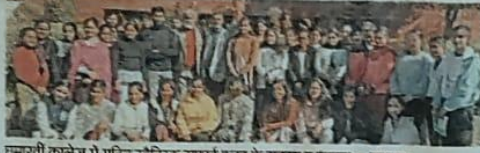
घुमारवीं कॉलेज में गठित स्वैच्छिक सफाई क्लब के सदस्य व प्रवक्ता