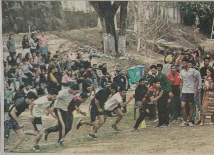
घुमारवीं। वार्षिक खेलकूद प्रतियोगिता के दौरान भाग लेते प्रतिभागी व अन्य