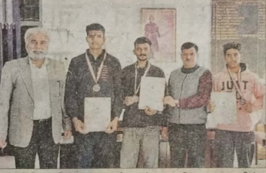
मुक्केबाजी स्पर्धा में उत्कृष्ट प्रदर्शन करने पर महाविद्यालय घुमारवीं के छात्रों को सम्मानित करते प्राचार्य और अन्य ।