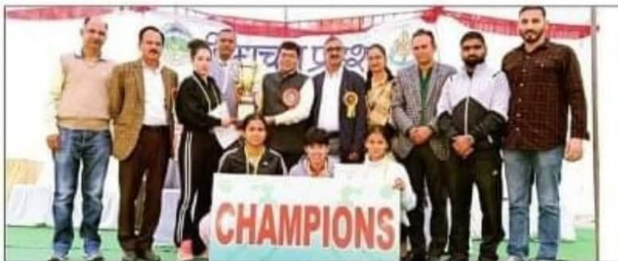
बिलासपुर के घुमारवीं में अंतर कॉलेज बैडमिंटन प्रतियोगिता की विजेता खिलाड़ी।